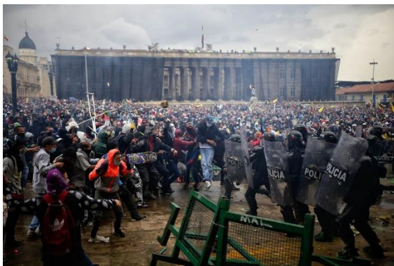
Protests prompt colombia to abandon tax overhaul. (s. f.). The New York Times.

Actualmente, no existe una ley que permita la liberación de los jóvenes de la Primera Línea presos como gestores de paz en Colombia. Aunque el presidente Gustavo Petro ha nombrado a algunos miembros de la Primera Línea como "gestores de paz", el decreto publicado los cataloga como voceros y la ley 2272 de Colombia no permite la liberación de procesados que no reúnen las condiciones que fija la ley para los gestores de paz. La Ley de la Paz Total, sancionada por el presidente Petro en noviembre de 2022, permite a su administración iniciar negociaciones con grupos armados ilegales y destaca el Servicio Social para la Paz como una alternativa al Servicio Militar Obligatorio. Sin embargo, esta ley no permite la liberación de los jóvenes de la Primera Línea presos como gestores de paz en Colombia.