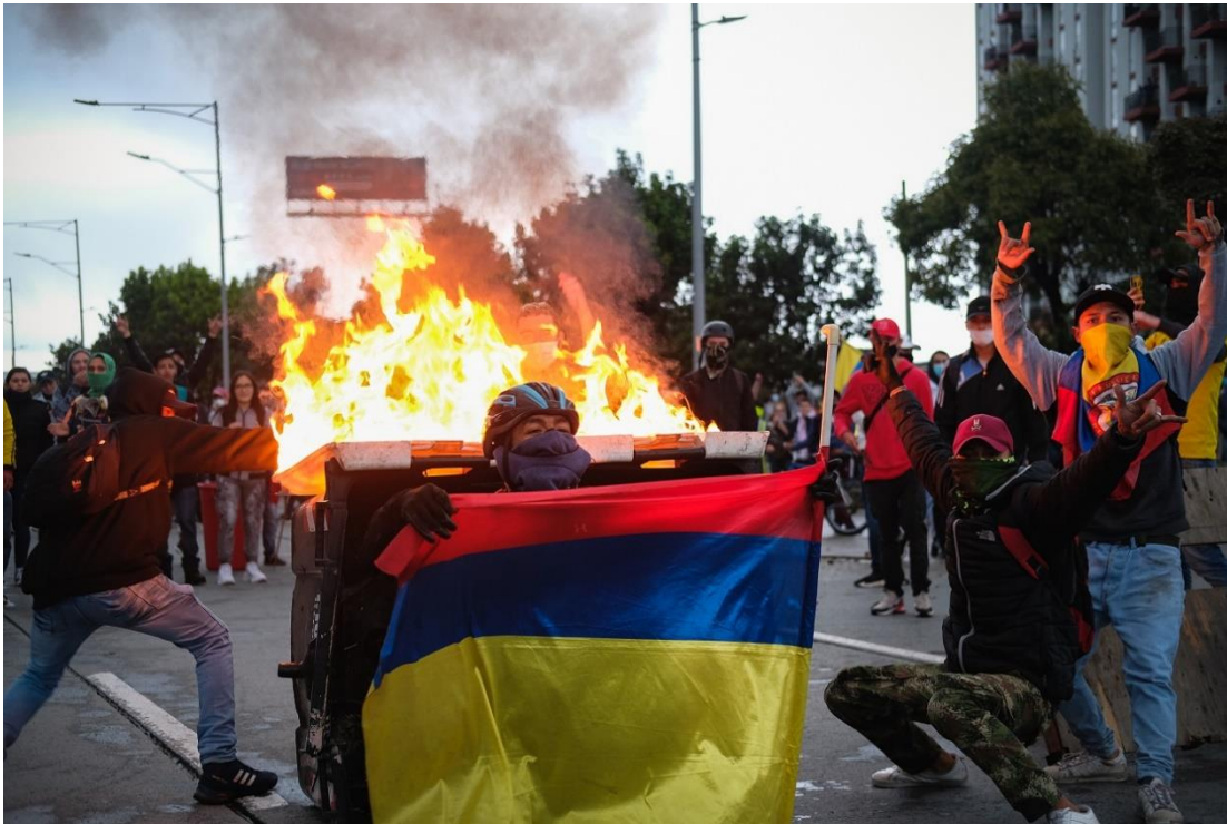
Paro nacional en Colombia rodeado de polarización e incertidumbre - diálogo político. (s. f.). Dialogo politico.

https://dialogopolitico.org/wp-content/uploads/2021/06/shutterstock_1969695871_1280.jpg.webp