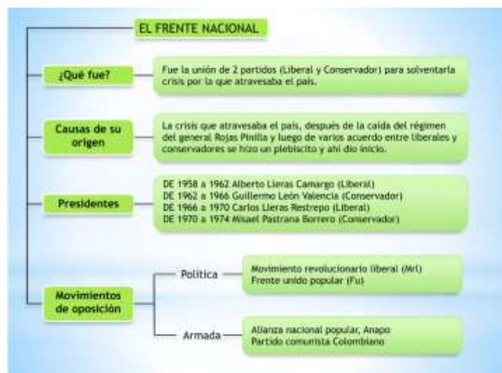
Imagen 3. Explicación del Frente Nacional

En 1953, a través de un golpe de estado el general Gustavo Rojas Pinilla toma el poder. Con promesas como pacificar el conflicto bipartidista y la amnistía entre las guerrillas liberales y comunistas fueron las principales razones del Congreso Nacional y la Asamblea Nacional Constituyente para terminar acreditando la toma de poder del general. Pero no todas las guerrillas se acogieron a la amnistía de Rojas Pinilla, algunas guerrillas comunistas se negaron a entregar las armas y acogieron las nuevas instrucciones del partido de desplegarse como una guerrilla móvil.