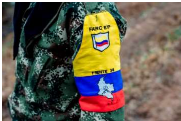
Imagen 5. Escudo de FARC-EP

Se debe entender que la mayoría de los campesinos residiendo en la República de Marquetalia eran integrantes de guerrillas comunistas que pelearon con las guerrillas liberales en años pasados en otros territorios del país. Cuando el presidente lanzó el plan de Operación Marquetalia, este mismo con el general y la brigada Sexta del Ejército aprovecharon para controlar la perspectiva del país. Lo que muchos no supieron es que algunos de los integrantes de Marquetalia lograron escapar el combate y con Manuel Marulanda Velez crearon las Fuerzas Armadas Revolucionarias de Colombia (FARC).