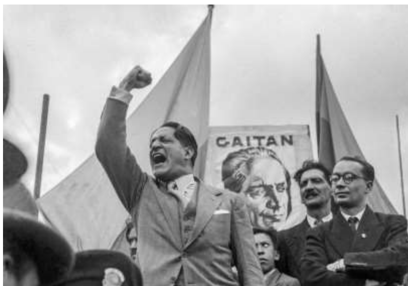
Imagen 2: Jorge Eliecer Gaitan

“se destacó por su magnitud, su cariz fratricida y por la impunidad que rodeó los actos atroces que se cometieron durante esos años. Como corolario dejó una enorme cantidad de hombres muertos, mujeres violadas y niños huérfanos. Fue una confrontación que, aunque permitió que las tierras cambiaran de manos mediante la expulsión de sus aterrorizados dueños, en lo fundamental no alteró la estructura agraria que venía prevaleciendo, ni la distribución general de la riqueza, ni las condiciones de la dominación política (Uribe-Calderón, 2007).”