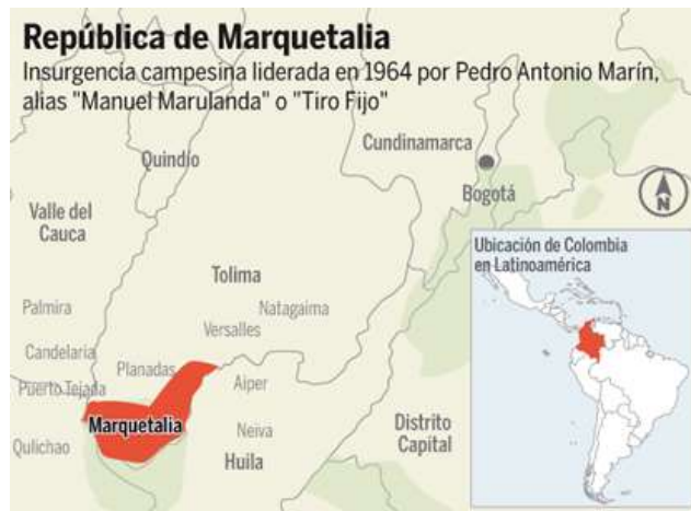
Imagen 1: Mapa de Marquetalia

El conflicto entre los campesinos y el gobierno ha durado muchos años, al igual que el conflicto por la tierra. Este se puede considerar como el mayor problema que sigue sin resolver. La mayoría de los campesinos que hoy en día viven en muchas de las tierras del país, llegaron al predio por alguna casualidad ya sea en la colonia o en algún punto de la historia. El problema radica en que esas tierras nunca pertenecieron legalmente a esas familias, por ende muchos de los campesinos del país están viviendo en propiedad del gobierno. Muchas reformas políticas han tratado de que esto sea mejorado y que los campesinos que han vivido décadas en esas tierras puedan vivir en ellas legalmente sin que el gobierno se las quite.