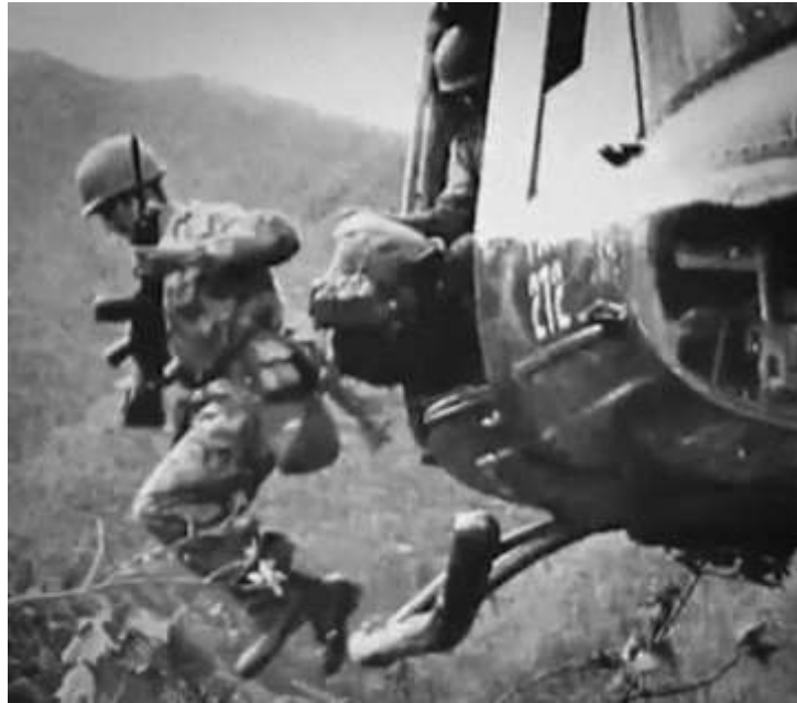
Imagen 4. 14 de junio 1964

comunistas en armas en el sur". Y tratar de conjurar, de paso, la grave crisis política que atravesaba el país" (Semana, s.f).